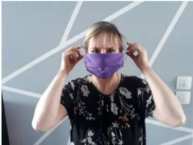
3) Passer les élastiques derrière les oreilles