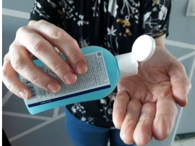
1) Se laver les mains à l'eau et au savon avant toute manipulation du masque