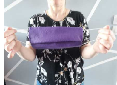
2) Prendre le masque par les élastiques