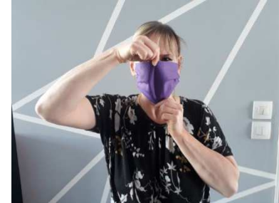
4) Ajuster le masque sur le haut du nez et en dessous du menton