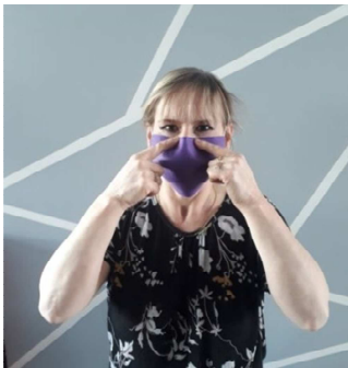
5) Pincer au niveau supérieur du nez